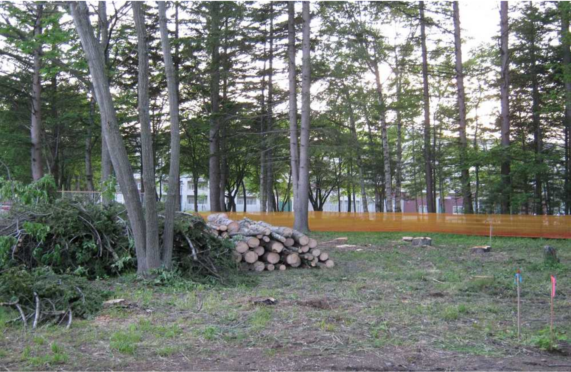
平成23年6月8日建設現場の状況